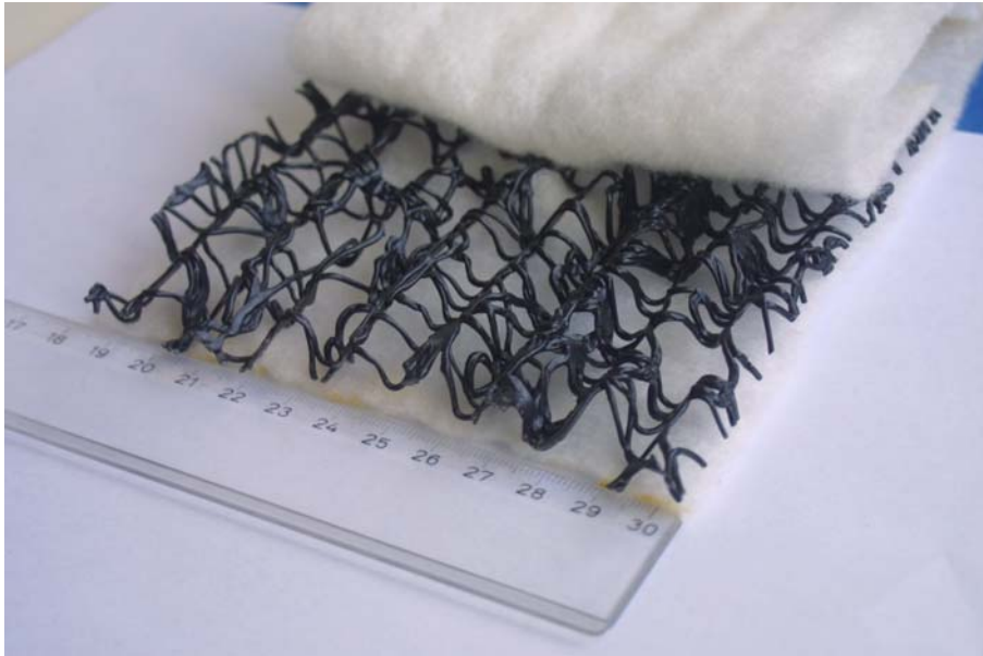
Bild 3: Ausschnitt aus dem Kunststoffdränelement Secudrän® R201Z WD601Z R201Z

Vor dem Hintergrund der im August 2005 erneuten dramatischen Hochwasserlagen in Bayern als Ergebnis von Starkniederschlägen aus einer Vb-Wetterlage soll besonders auf das Aufgrabungsergebnis der Testfelder auf der Deponie Kienberg 1999 hingewiesen werden. Hier fand eine Aufgrabung 1 Tag nach Starkregenereignissen, die zur letzten Katastrophen-Hochwassersituation 1999 führten, statt. Es konnte nachgewiesen werden, dass sich eine Secudrän-Dränmatte und die Regeldrängschicht aus 30 cm Kies 16/32 mm in der Dränleistung nicht unterschieden [14] und die Dränabflüsse als Folge des Starkregens sicher abgeführt werden konnten. 1 Tag nach den Regenfällen zeigte sich im Secudrän-Kunststoffdränsystem keinerlei Rückstau – das Sickerwasser war bereits komplett abgeführt worden. Grundsätzlich gilt, dass die Ermittlung einer maßgebenden Dränspende immer noch wesentlich anspruchsvoller und aufwendiger ist, als die anschließende Bemessung bzw. Auslegung der Wasserableitkapazität des Dränsystems. Für die Ermittlung der Dränspende wird der Einsatz der bekannten Wasserhaushaltsmodelle z.B. nach HELP oder BOWAHALD empfohlen. Die z.B. auch in der GDA-Empfehlung E 2-20 genannten (Vor)Bemessungswerte erscheinen nicht zuletzt vor dem Hintergrund der immer häufiger ausgeführten Rekultivierungsschichtstärken von 1,5 m sehr konservativ.